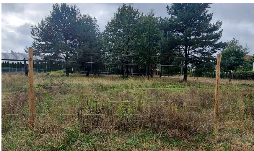
Wygrodzenia terenów zieleni – siatka leśna

- tereny zieleni wokół drzew istniejących należy wygrodzić (zgodnie z zakresem wskazanym na rys. 2 ) na cały czas trwania robót drogowych siatką leśną o wysokości 2 m przymocowaną do drewnianych palików o średnicy min. 8 cm. Ogrodzenie należy wbić w grunt, aby nie było przestawiane w czasie prowadzenia robót i zamieścić na nim tabliczki z informacją dla pracowników „STREFA OCHRONNA DRZEWA – nie wchodzić, nie przesuwać ogrodzenia, nie składować materiałów”.